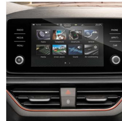
Infotainment BOLERO Das Infotainmentsystem BOLERO bietet einen 8"-Farb-Touchscreen, zwei USB-C-Anschlüsse und SmartLink.