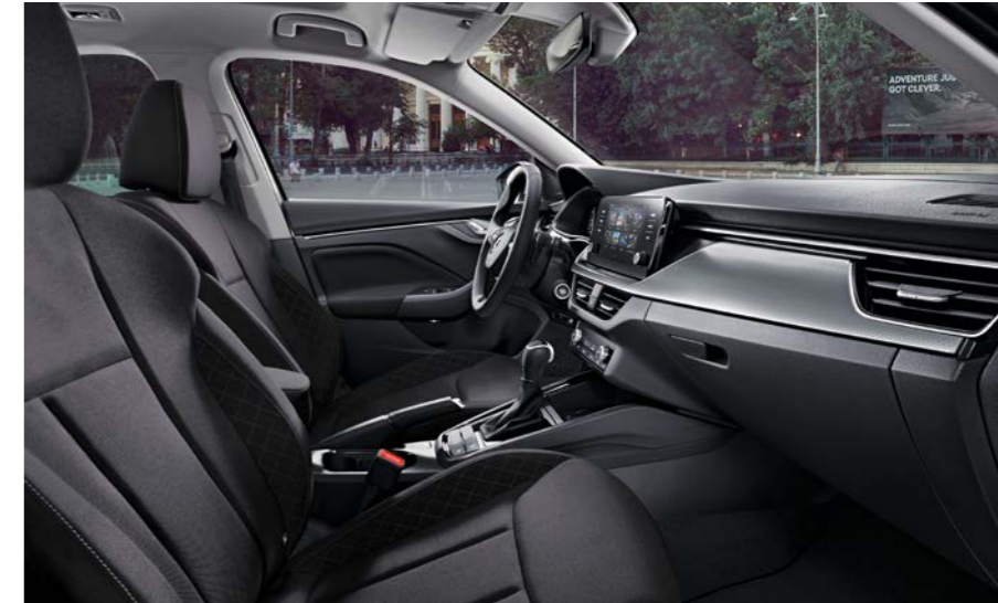
Mit den weichen schwarzen Sitzbezügen und den grauen Seitenwangen mit weisser Ziernaht wird der ŠKODA KAMIQ Fresh einen bleibenden ersten Eindruck hinterlassen.